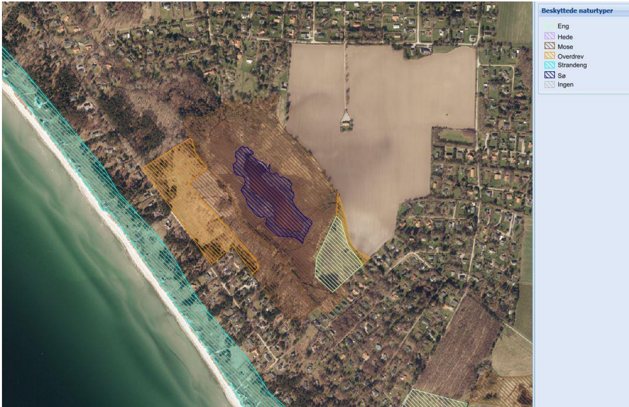
Kort 2. Beskyttede naturtyper i Piledybet.

I området yngler rørhøg og rørdrum, som er på udpegningsgrundlaget for fuglebeskyttelsesområdet. Området er i Natura 2000-planen udpeget som et potentielt levested for plettet rørvagtel, og projektet vil skabe bedre forhold for denne art samt en række andre vandfugle.